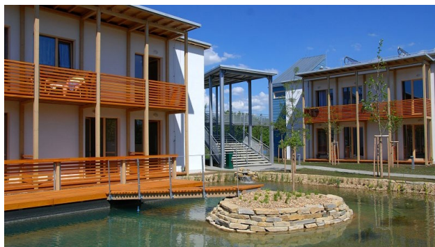
Pasivní Dům pro seniory v Modřicích - vítěz Building Efficiency Award 2014, kategorie Multi Comfort House